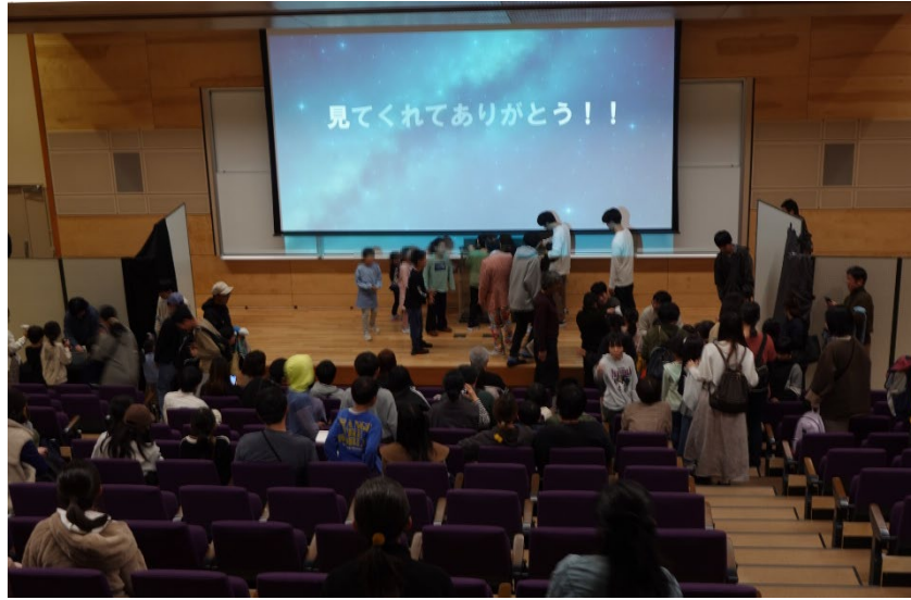
マジックショー後に参加型マジックに触れている小学生