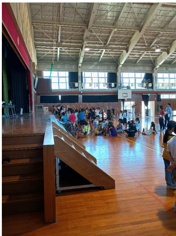
小学生がマジックに参加してくれる様子