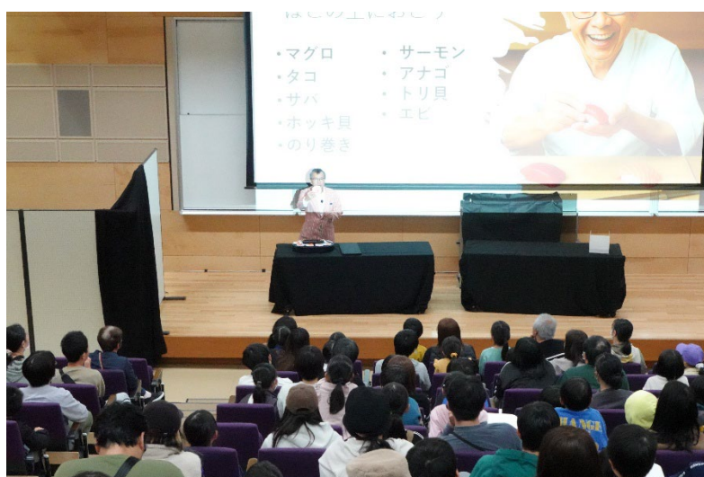
寿司マジックの説明