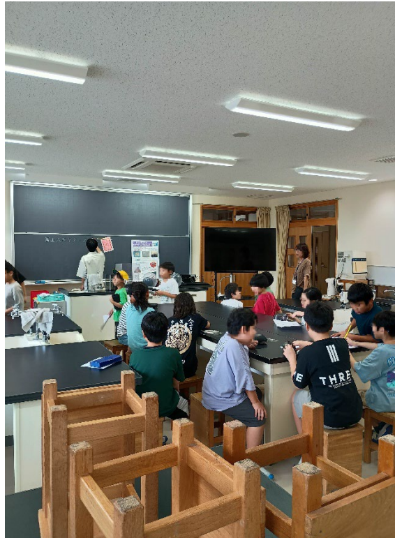
学生が準備をする様子2