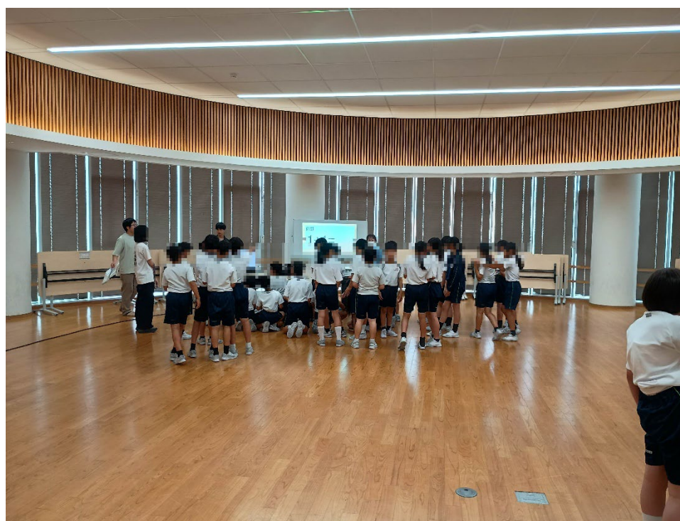
学生がマジックの準備をしている様子