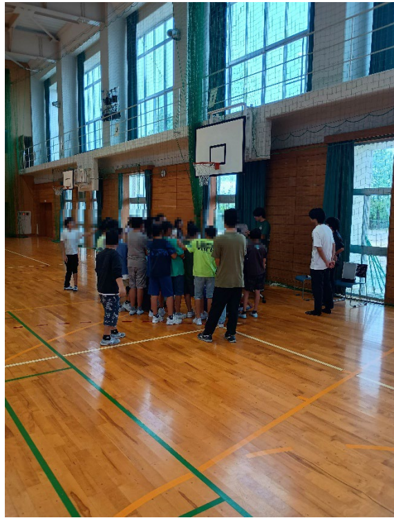
小学生がマジックに集中する様子