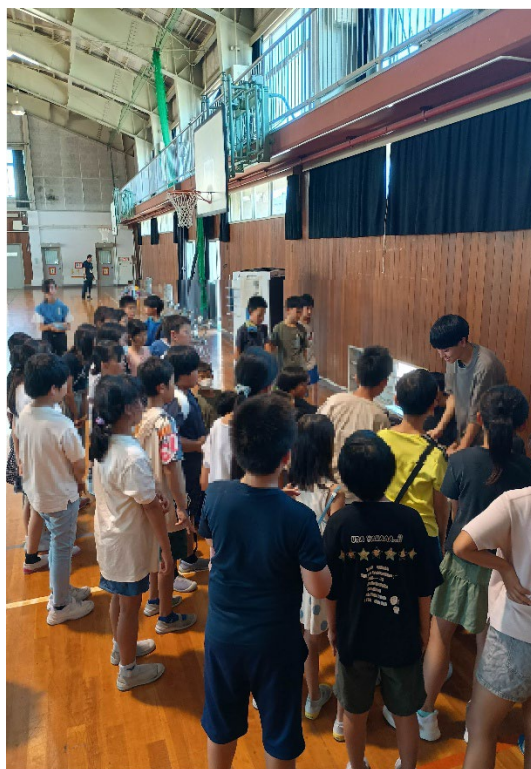
小学生がマジックを楽しんでくれる様子