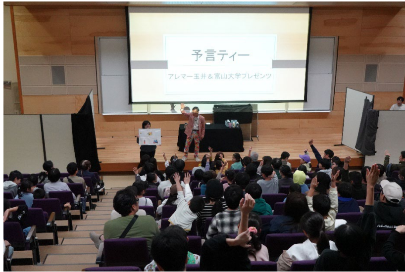
予言ティーマジックの参加を募集するアレマーさん