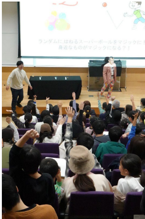
スーパーボールマジックに参加したい小学生