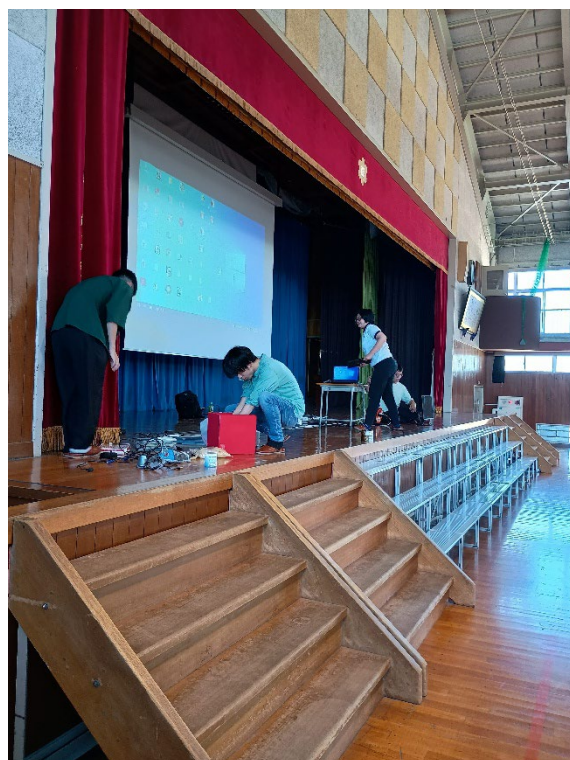
学生がマジックを準備している様子

藤ノ木小学校では、申し込み時の 555 名では実施が難しいと判断し、学年を絞り約 200 名での実施になりました。1 回目の出前教室に引き続き種明かしを交え、生徒の興味を引くことができ大人数のなかでも成功することができました。マジックの披露中、机の裏側まで来るほどの食いつきで大変楽しんでもらえました。