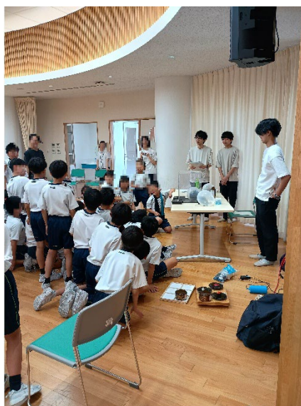
小学生が種を予想し発表している様子