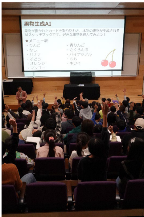
AI マジックに参加したい小学生