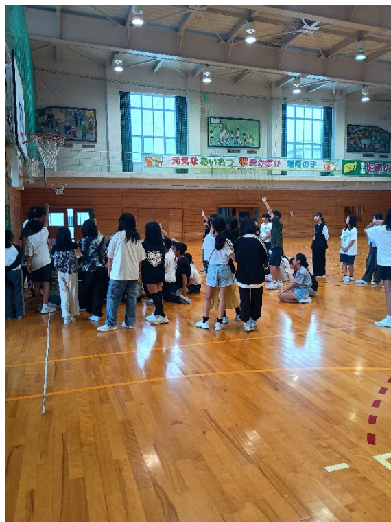
小学生がマジックに参加してくれる様子