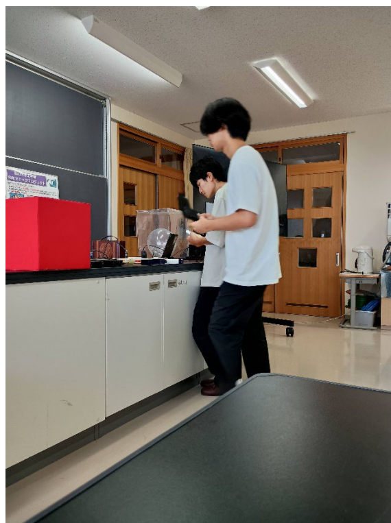
学生がマジックの準備をする様子

速星小学校では、サイエンスクラブの比較的少人数を相手に出前教室を実施し各マジックを実施後に丁寧に解説することができ、より詳しく知ってもらうことができました。また、実際にマジック道具に触れられる時間を設けることができ、全体では発言しにくい生徒もその際に質問をしてくれたことでより楽しんでいただけた印象でした