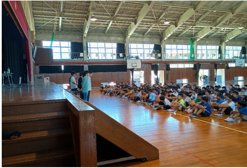
学生がプロジェクトの内容を説明している様子