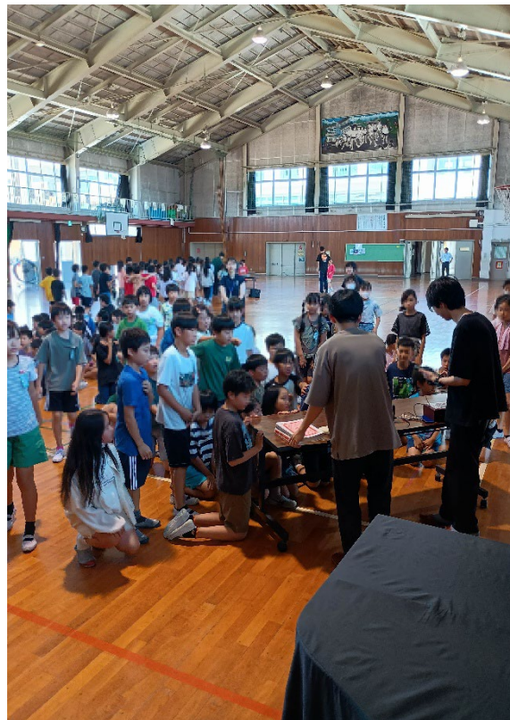
小学生がマジックを見ている様子